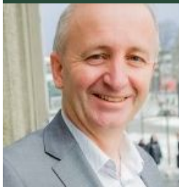
Lorents Nord-Varhaug Aftenmøder 19.30 lørdag-tirsdag

14.-21. juli 2018 på Djurslands Efterskole, Kanneshøjvej 43, 8585 Glesborg