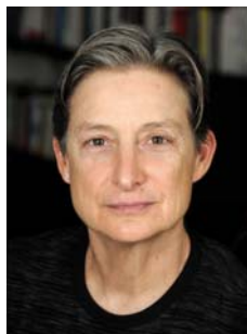
Judith Butler (1956-)

Den bog, som mere end nogen anden har banet vej for denne tankegang, er Judith Butlers Kønsballade fra 1990. 20 Butler hævder, at det er en social konstruktion uden grundlag i naturen at tænke i to køn og at definere den heteroseksuelle kærlighed som naturlig. Der er slet ingen biologiske køn, og der er intet naturligt i, at mænd og kvinder tiltrækkes af hinanden. Det er kulturelle idéer, som fastlåser det enkelte individ i ufrihed. Vi må gøre os fri af alle kulturelle forestillinger om køn. Vi må selv konstruere vores køn og selv fylde det med indhold. Det er frihed!