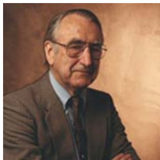
John Money (1921-2006)